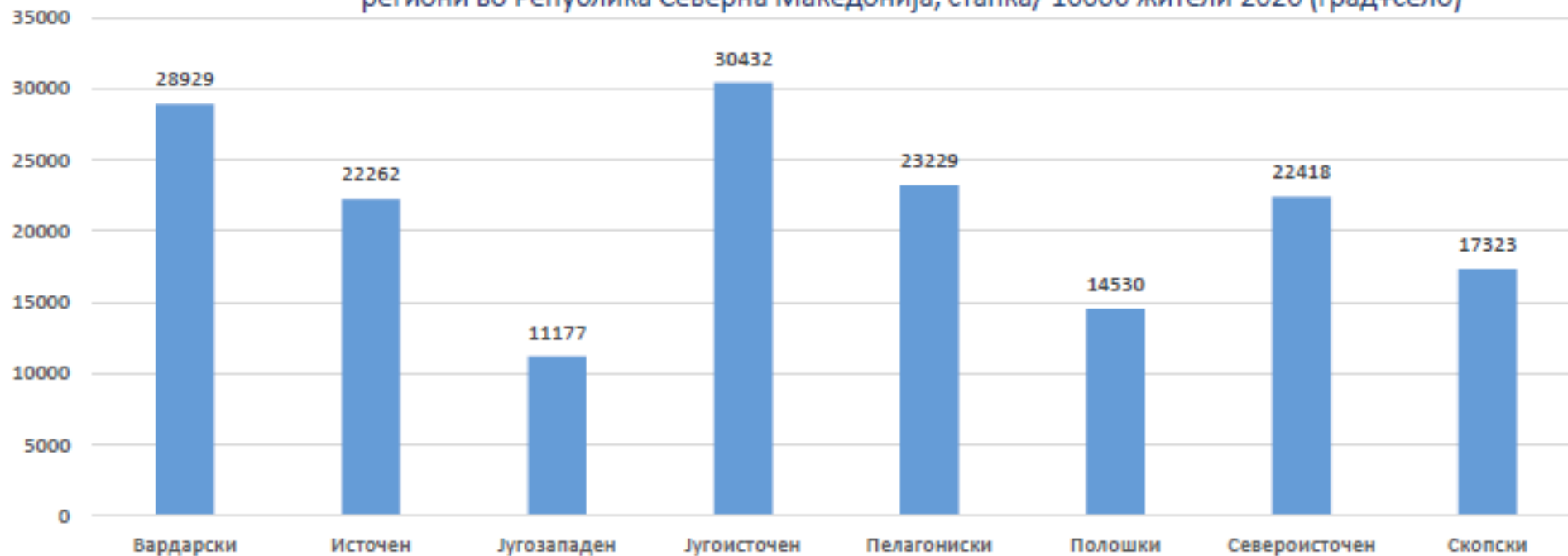
Утврдени заболувања (субтотали) во дејноста за здравствена заштита на деца по географски региони во Република Северна Македонија, стапка/ 10000 жители 2020 (град+село)